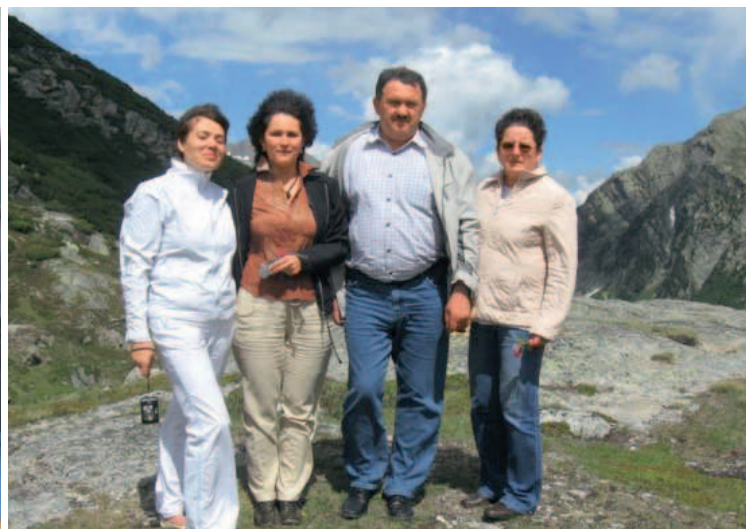
Ein gemeinsam erklommener Gipfel zeigt nicht nur die Schönheit der Schweizer Berge, sondern macht auch den Kopf wieder frei.