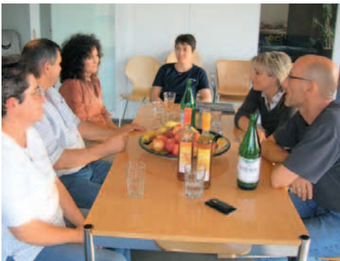
Während des viertägigen Expertenaustausches stand vor allem das Thema „Lebensqualität und Demenz“ im Mittelpunkt der Gespräche.