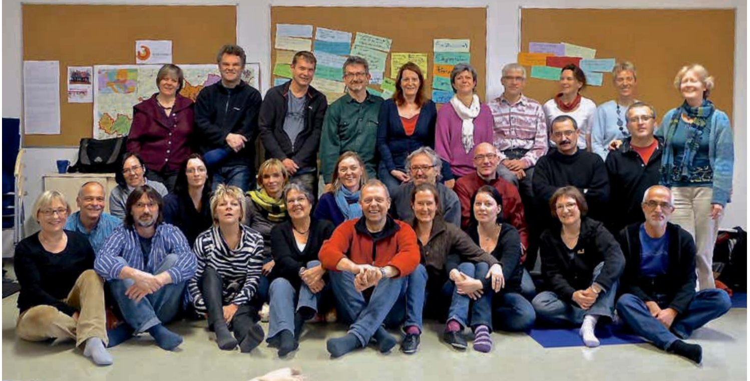
Die Delegierten der 5 Länderorganisationen nach zwei arbeitsreichen Tagen in Linz.