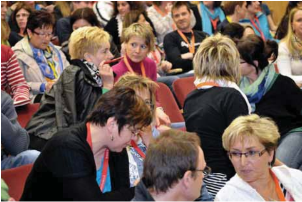
Oben: Dr. Josef Pühringer, Landeshauptmann von Oberösterreich eröffnet die Fachtagung. Unten: Eine angeregte Diskussion (Unten):

Herangehensweisen gegenübergestellt, deren Hintergrund die Erfüllung gesetzlicher Richtlinien bildet. In allen Ländern sollen MitarbeiterInnen durch gesetzliche Richtlinien vor körperlichen Schäden bewahrt werden. Dies kann dazu führen, dass Einrichtungen in Lifter und Heber investieren. Ähnlich wie bei standardisierten Pflegemaßnahmen birgt diese Erfüllung von Gesetzen die Gefahr, dass nicht darauf geachtet wird, was KlientInnen bei solchen Transfers lernen und welche Wirkung sie auf ihre Gesundheitsentwicklung (und diejenige der Pflegenden) haben. Die Referentinnen stellten eindrucksvoll dar, wie die MitarbeiterInnen und KlientInnen ihrer Einrichtung nach Kinaesthetics-Schulungen zunehmend kompetenter wurden. Die körperliche Belastung nahm ab und die MitarbeiterInnen übernahmen zunehmend mehr Verantwortung. Sie lernten, ihre Pflege-Interaktionen individuell anzupassen und hinsichtlich der Qualität für die KlientInnen und sich selbst zu begründen. Diese Erfahrungen aus einer italienischen und österreichischen Einrichtung ergaben einen gemeinsamen Tenor: Wird die Kompetenzentwicklung ins Zentrum der betrieblichen Entwicklung gestellt, ist auch die Erfüllung von Gesetzen gewährleistet.